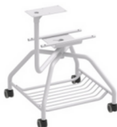
GRIS RAL 7035