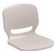
GRIS PARDO 406