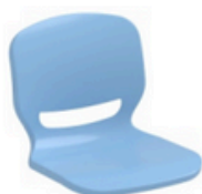
AZUL PASTEL 2169