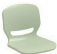
VERDE PASTEL 623