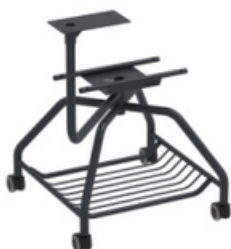
GRAFITO RAL 7021